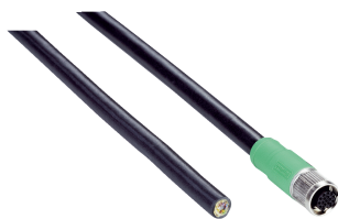
图片可能存在偏差