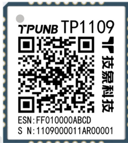
图 1 模组俯视图