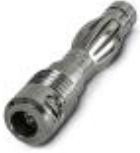
测试插头，颜色: 银色