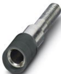
测试孔式连接器，颜色: 黑色

Please be informed that the data shown in this PDF Document is generated from our Online Catalog. Please find the complete data in the user's documentation. Our General Terms of Use for Downloads are valid ( http://download.phoenixcontact.com )