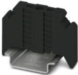
终端固定件，宽度: 9.5 mm，高度: 32.8 mm，标识材料: PA，长度: 48.6 mm，颜色: 黑色

Please be informed that the data shown in this PDF Document is generated from our Online Catalog. Please find the complete data in the user's documentation. Our General Terms of Use for Downloads are valid ( http://download.phoenixcontact.com )