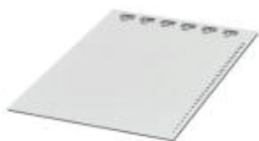
图示产品为非屏蔽型号ESL 29 x 8

插入式标记条，可订购：标签纸，白色，根据客户要求标识，安装方式：插入，标识区域大小：44 x 7 mm