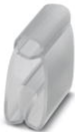
导线标记条支架，透明，未标记，安装方式: 滑块，电缆直径范围: 6 - 10 mm，标识区域大小: 12 x 4 mm

Please be informed that the data shown in this PDF Document is generated from our Online Catalog. Please find the complete data in the user's documentation. Our General Terms of Use for Downloads are valid ( http://download.phoenixcontact.com )