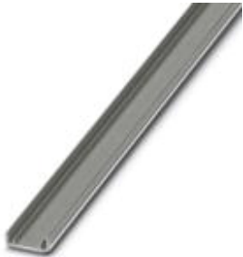
设备简介，不干胶，1000 Mm 长，用于安装 UC 和 US 材料，高：15 mm

Please be informed that the data shown in this PDF Document is generated from our Online Catalog. Please find the complete data in the user's documentation. Our General Terms of Use for Downloads are valid ( http://download.phoenixcontact.com )