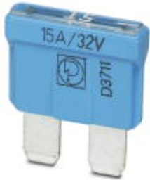
插拔式保险丝插座，C类，颜色编码：淡蓝色，额定电流：15 A ...

Please be informed that the data shown in this PDF Document is generated from our Online Catalog. Please find the complete data in the user's documentation. Our General Terms of Use for Downloads are valid ( http://download.phoenixcontact.com )