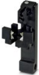
备件加工插件1.5 mm 2 ，用于压接设备CF 3000-2,5

Please be informed that the data shown in this PDF Document is generated from our Online Catalog. Please find the complete data in the user's documentation. Our General Terms of Use for Downloads are valid ( http://download.phoenixcontact.com )