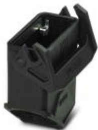
HEAVYCON EVO法兰式外壳，塑料，带用于EVO螺钉连接的卡口法兰，B10，带单锁扣，高度：90 mm，不包括EVO螺钉连接

Please be informed that the data shown in this PDF Document is generated from our Online Catalog. Please find the complete data in the user's documentation. Our General Terms of Use for Downloads are valid ( http://download.phoenixcontact.com )