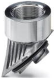
适配器，铝制，用于EVO外壳，M32螺纹

Please be informed that the data shown in this PDF Document is generated from our Online Catalog. Please find the complete data in the user's documentation. Our General Terms of Use for Downloads are valid ( http://download.phoenixcontact.com )