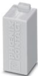
HEAVYCON封堵模块，用于模块支架框中未使用的插槽

Please be informed that the data shown in this PDF Document is generated from our Online Catalog. Please find the complete data in the user's documentation. Our General Terms of Use for Downloads are valid ( http://download.phoenixcontact.com )