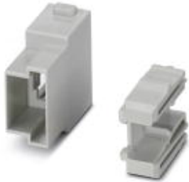
插芯模块，位数: RJ45，型号: RJ45，针脚，50 V，1 A，应用: 数据，带用于RJ工业连接器的适配器

Please be informed that the data shown in this PDF Document is generated from our Online Catalog. Please find the complete data in the user's documentation. Our General Terms of Use for Downloads are valid ( http://download.phoenixcontact.com )