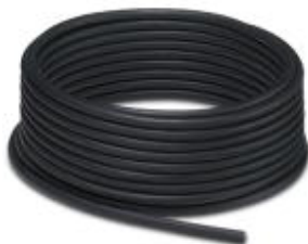
电缆, PVC, 黑色, 4芯, 颜色: 棕色/白色/蓝色/黑色, 长度: 100 m

Please be informed that the data shown in this PDF Document is generated from our Online Catalog. Please find the complete data in the user's documentation. Our General Terms of Use for Downloads are valid ( http://download.phoenixcontact.com )